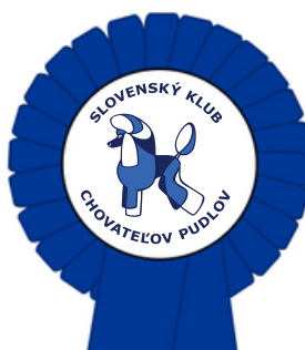
stredná, otvorená, šampiónov