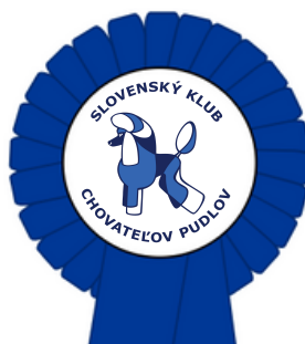
stredná, otvorená, šampiónov